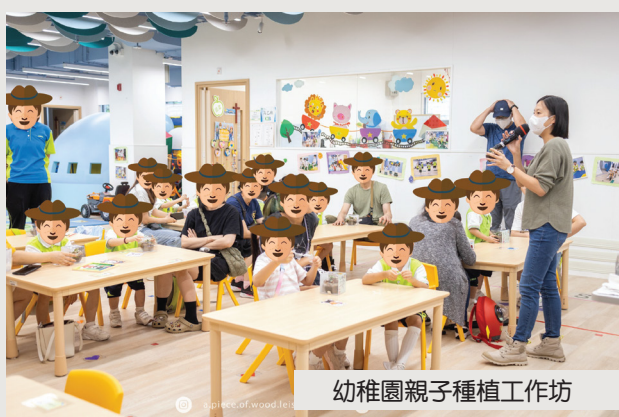
幼稚園親子種植工作坊

這幾年間，農莊團隊帶著園藝治療走遍全港，足跡從最北的上水延伸至最南的薄扶林。我們走出農莊，進入學校、中心、企業和商場，為社區上不同群體提供服務。同時，我們亦積極參與青少年工作實戰計劃，為中學生提供職業體驗，讓他們在職場中尋找自我價值。