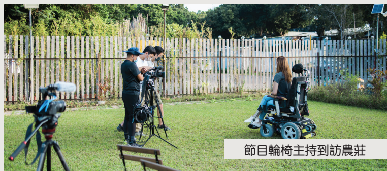
節目輪椅主持到訪農莊

回想這段過程中，成長的不只是參加者，也是我們自己，因為在教授種植的同時有幸傾聽了無數動人的生命故事，這些共鳴與回饋也不斷啟發著我們的成長。