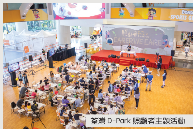
荃灣 D-Park 照顧者主題活動