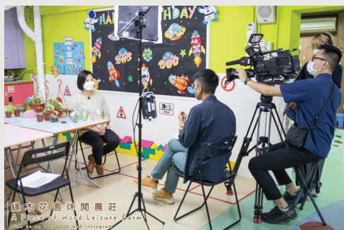
銀木花園休閒農莊 A Place of Wood Leisure Farm 100, 102, 104, 106, 108, 110, 112, 114, 116, 118, 120, 122, 124, 126, 128, 130, 132, 134, 136, 138, 140, 142, 144, 146, 148, 150, 152, 154, 156, 158, 160, 162, 164, 166, 168, 170, 172, 174, 176, 178, 180, 182, 184, 186, 188, 190, 192, 194, 196, 198, 200, 202, 204, 206, 208, 210, 212, 214, 216, 218, 220, 222, 224, 226, 228, 230, 232, 234, 236, 238, 240, 242, 244, 246, 248, 250, 252, 254, 256, 258, 260, 262, 264, 266, 268, 270, 272, 274, 276, 278, 280, 282, 284, 286, 288, 290, 292, 294, 296, 298, 300, 302, 304, 306, 308, 310, 312, 314, 316, 318, 320, 322, 324, 326, 328, 330, 332, 334, 336, 338, 340, 342, 344, 346, 348, 350, 352, 354, 356, 358, 360, 362, 364, 366, 368, 370, 372, 374, 376, 378, 380, 382, 384, 386, 388, 390, 392, 394, 396, 398, 400, 402, 404, 406, 408, 410, 412, 414, 416, 418, 420, 422, 424, 426, 428, 430, 432, 434, 436, 438, 440, 442, 444, 446, 448, 450, 452, 454, 456, 458, 460, 462, 464, 466, 468, 470, 472, 474, 476, 478, 480, 482, 484, 486, 488, 490, 492, 494, 496, 498, 500, 502, 504, 506, 508, 510, 512, 514, 516, 518, 520, 522, 524, 526, 528, 530, 532, 534, 536, 538, 540, 542, 544, 546, 548, 550, 552, 554, 556, 558, 560, 562, 564, 566, 568, 570, 572, 574, 576, 578, 580, 582, 584, 586, 588, 590, 592, 594, 596, 598, 600, 602, 604, 606, 608, 610, 612, 614, 616, 618, 620, 622, 624, 626, 628, 630, 632, 634, 636, 638, 640, 642, 644, 646, 648, 650, 652, 654, 656, 658, 660, 662, 664, 666, 668, 670, 672, 674, 676, 678, 680, 682, 684, 686, 688, 690, 692, 694, 696, 698, 700, 702, 704, 706, 708, 710, 712, 714, 716, 718, 720, 722, 724, 726, 728, 730, 732, 734, 736, 738, 740, 742, 744, 746, 748, 750, 752, 754, 756, 758, 760, 762, 764, 766, 768, 770, 772, 774, 776, 778, 780, 782, 784, 786, 788, 790, 792, 794, 796, 798, 800, 802, 804, 806, 808, 810, 812, 814, 816, 818, 820, 822, 824, 826, 828, 830, 832, 834, 836, 838, 840, 842, 844, 846, 848, 850, 852, 854, 856, 858, 860, 862, 864, 866, 868, 870, 872, 874, 876, 878, 880, 882, 884, 886, 888, 890, 892, 894, 896, 898, 900, 902, 904, 906, 908, 910, 912, 914, 916, 918, 920, 922, 924, 926, 928, 930, 932, 934, 936, 938, 940, 942, 944, 946, 948, 950, 952, 954, 956, 958, 960, 962, 964, 966, 968, 970, 972, 974, 976, 978, 980, 982, 984, 986, 988, 990, 992, 994, 996, 998, 1000

這份努力在 2022 年底被媒體看見，我們獲邀參與香港電台共融節目《睇得見·聽得到》的專訪，拍攝團隊用鏡頭捕捉了我們在農莊與外展活動中的點滴，也完整呈現了我們在農莊營運及外展服務上的成效。這份紀錄不僅成為我們過往工作一個階段性的總結，也肯定了園藝治療在推動社會共融上的貢獻。