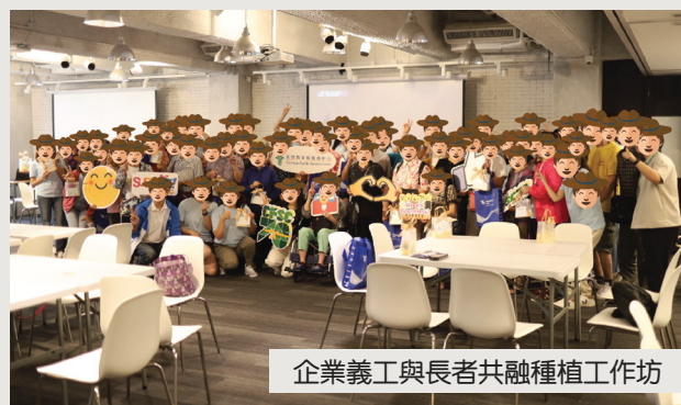
企業義工與長者共融種植工作坊